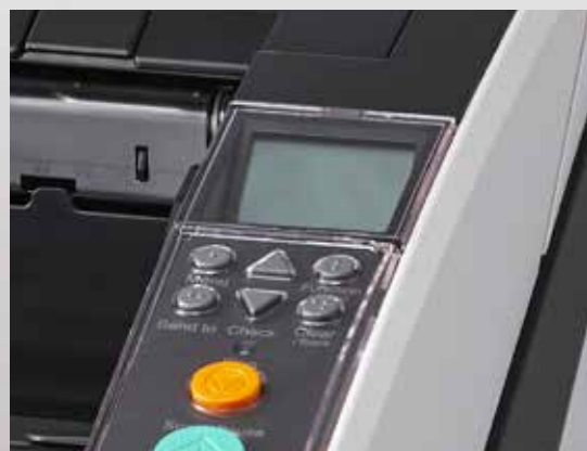
Écran à cristaux liquides intégré dans le panneau de commande

Les scanners fi-7800 et fi-7900 de Fujitsu constituent une solution de numérisation complète. La combinaison de nos scanners, de nos logiciels et d'un service client qui compte parmi les meilleurs sur le marché vous fournit tout ce dont vous avez besoin pour améliorer la productivité de vos processus et libérer ainsi du temps pour vos collaborateurs. Vous pourrez ainsi mieux vous concentrer sur votre cœur de métier plutôt que sur la technologie.